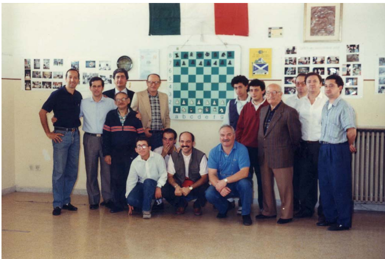
I partecipanti del 1° Campionato Italiano Individuale 1990